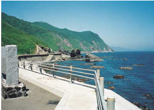
白神岬から見た国道228号

この道は、松前藩の成立以前から、細い踏み分け道があったとされる。また、千軒岳の周辺では、慶長年間（一六一〇年ころ）に砂金が発見されて以来、空前のゴールドラッシュが起きた。本州各地から江差、松前などに渡ってきた