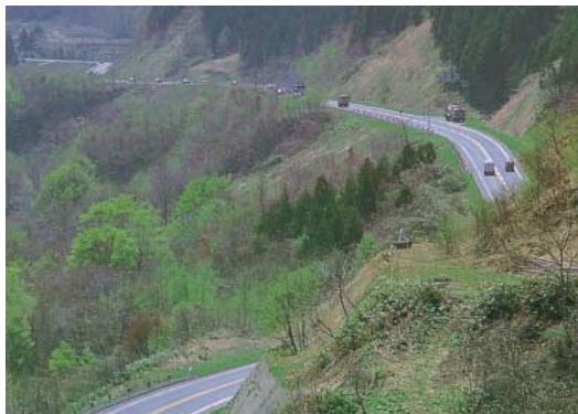
難所の一つであった福島峠

白神岬の断崖上には、明治二一年に建設された高さ一七mのコンクリート製の灯台がある。津軽海峡を通る船舶の玄関番ともいえる重要な