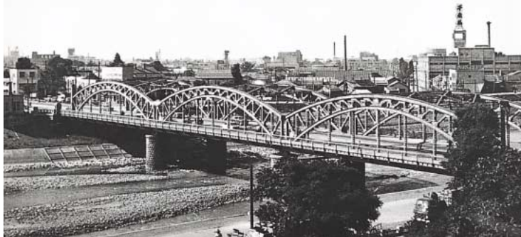
名橋の誉れの高かった「先代豊平橋」

工事費は本橋部が、六十五万七千四百一十二円、付帯工費が十四万六千六百十七円（取り付け道路、護岸堤防等）の合計八十万三千七百五十九円