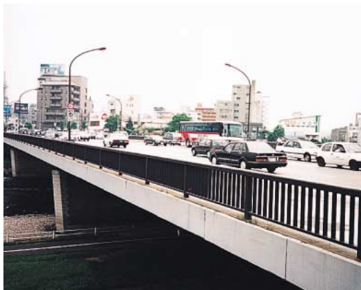
昭和41年完成の現在「豊平橋」

北海道開発局の『局報』には、かつてこの橋が架け換えられることになった時「老兵は消えるのみと寂しい言葉であるが、多分に感傷的である。名橋であるがゆえに：この橋の存在を願う人もあれば、危険なるがゆえに新橋の架け換えを望む人もいる。いずれが正しいか、見る人の考え方によって異なるであろう。われわれが計画した新橋が、旧橋にも勝る名橋であるとはいえない。多分にその時代の社会情勢に左右されることである。しかし、現時点に立てばより合理的であるという自負はある。合理的であるがゆえに、札幌市にふさわしい名橋であるということにはならない。何十年かたてばこの橋も、また架け換えられなければならない時点がかかることであろう。